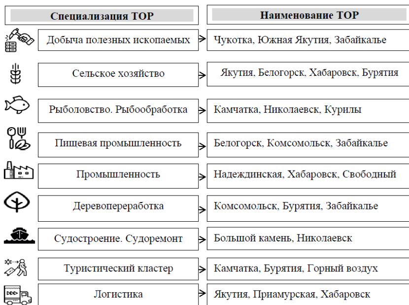
Рисунок 1 – Специализация территорий опережающего развития ДФО

По состоянию на 01.07.2020 года в Дальневосточном федеральном округе было создано 20 ТОР. За период 2021-2022 гг. было сформировано еще три ТОР: Краснокаменск, Селенгинск, Столица Арктики. Рисунок 1 наглядно иллюстрирует специализацию каждой из функционирующих ТОР Дальневосточного федерального округа.